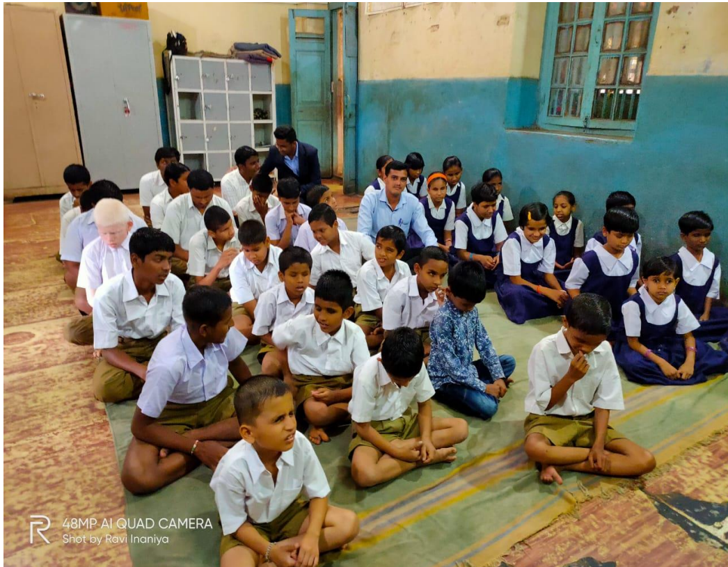
R 48MP AI QUAD CAMERA Shot by Ravi Inaniya