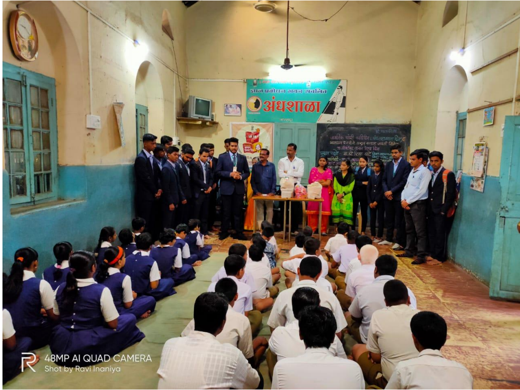
R 48MP AI QUAD CAMERA