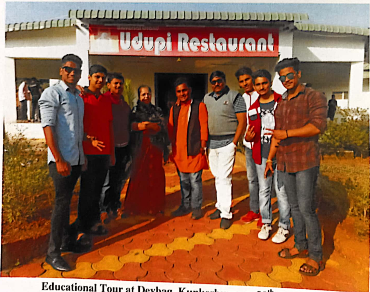
Educational Tour at Devbag, Kunkeshwar on 30 th Dec. 2018