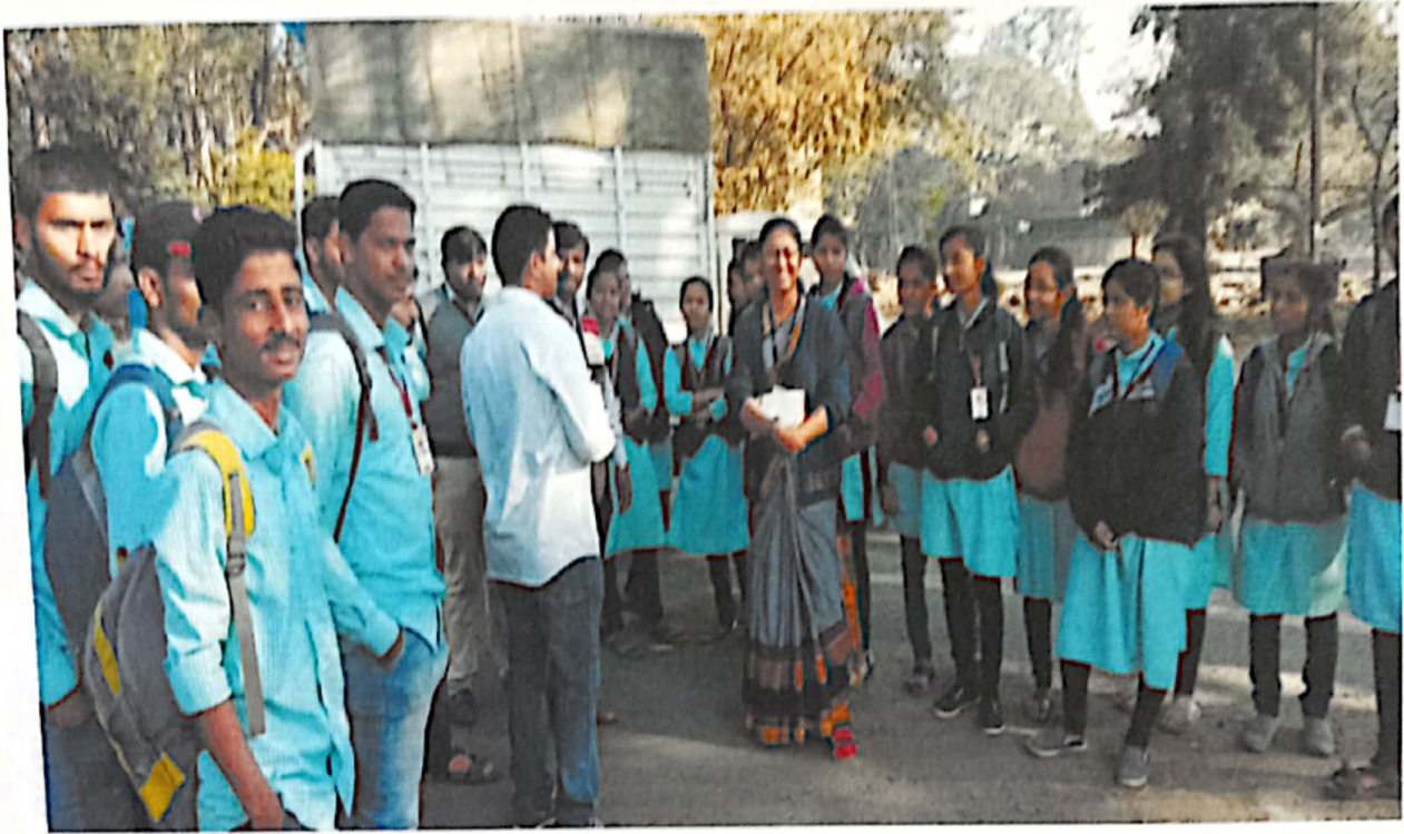
Visit to APC market on 1 st Jan 2019 of B.com students

Visit to APC Market, Kolhapur, on 1 st Jan, 2019 of B.Com - students