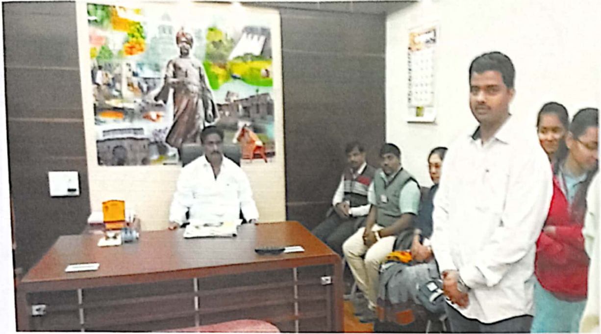
Discussion with Secretary, A.P.C Market, Kolhapur.