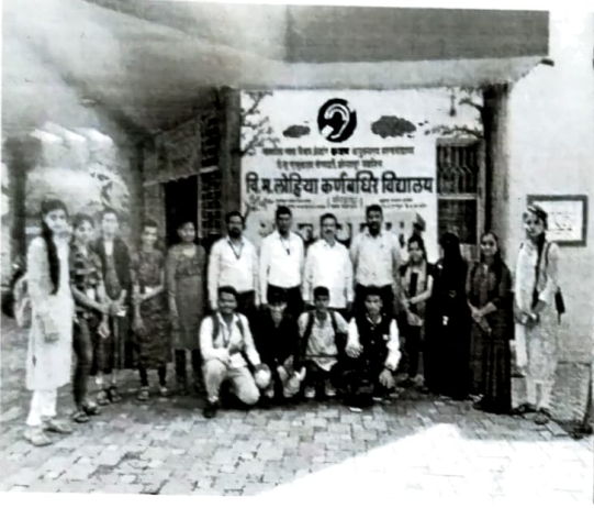
वि. म. लोहिया कर्णबधीर शाळेस भेट