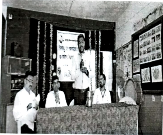
आभार – डॉ. प्रदीप पाटील