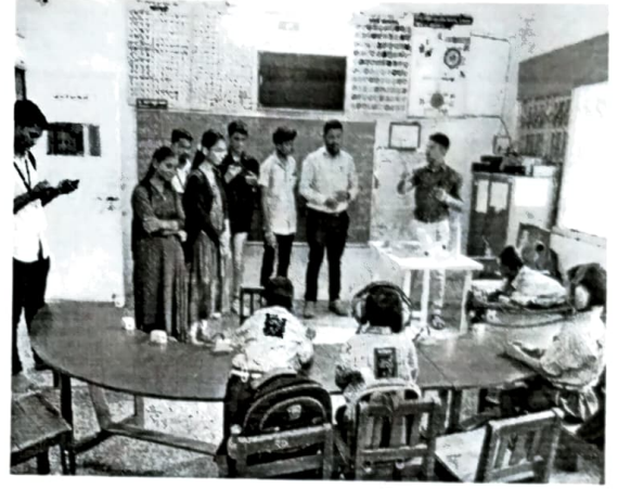
कर्णबधीर शाळेतील विद्यार्थ्यांशी संवाद