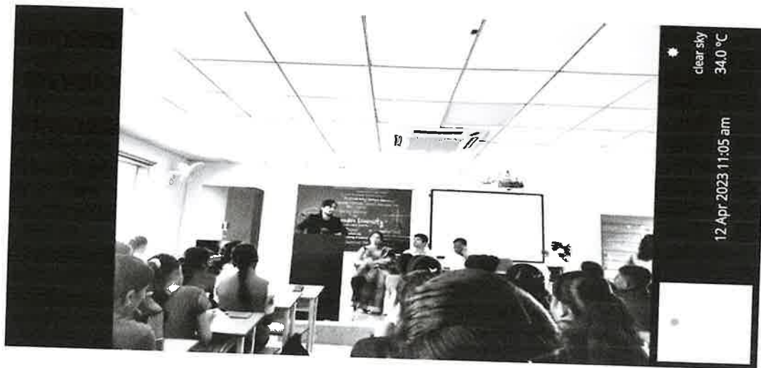
Chief Guest Speech (session –I) Gender Diversity & Inclusion