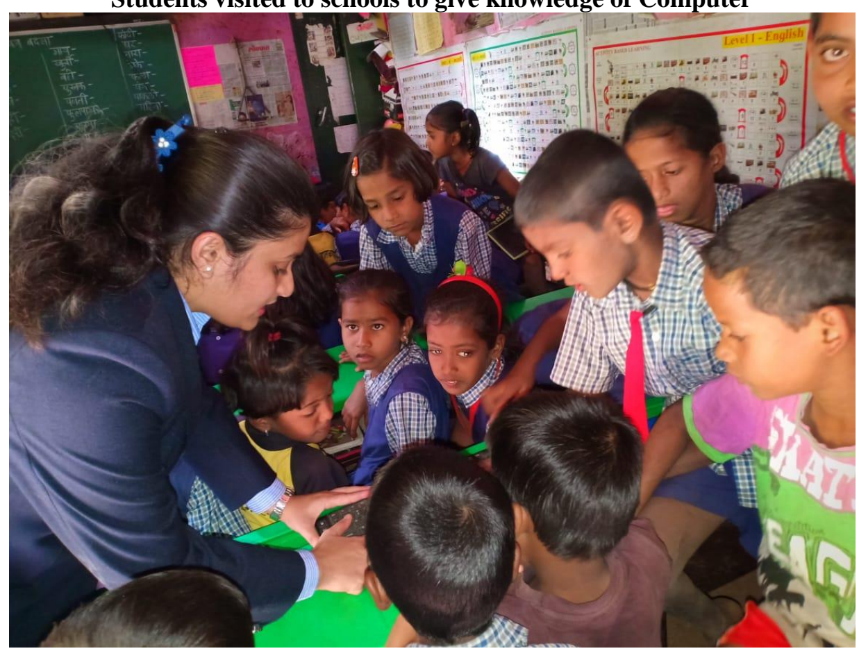
Best Practices-Students visited to schools to give knowledge of Computer