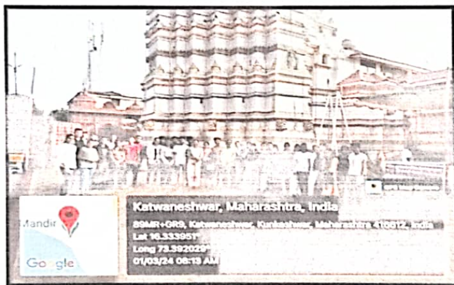
At Kunkeshwar Temple with B.Sc. II and III students