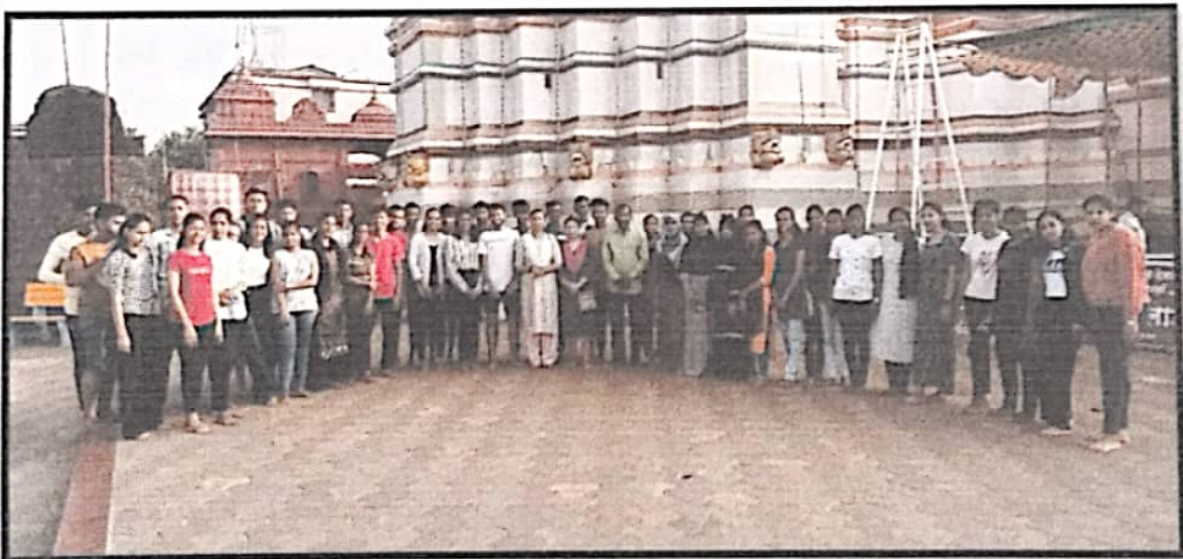
At Kunkeshwar Temple