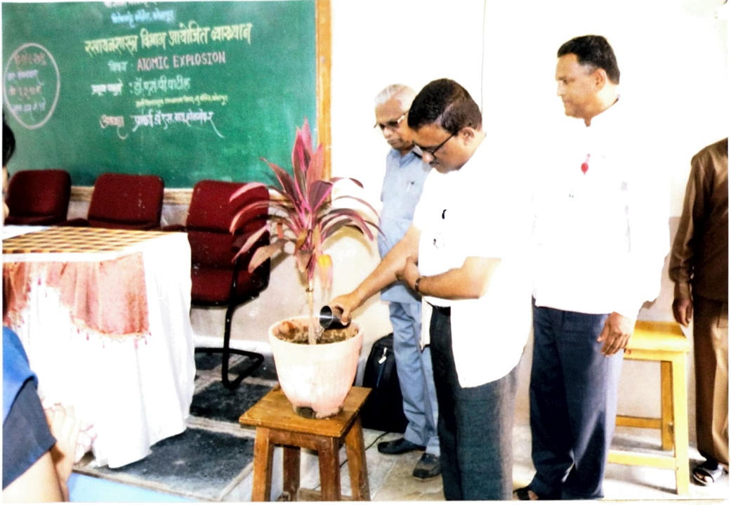
कार्यक्रमाचे उद्घाटन करताना