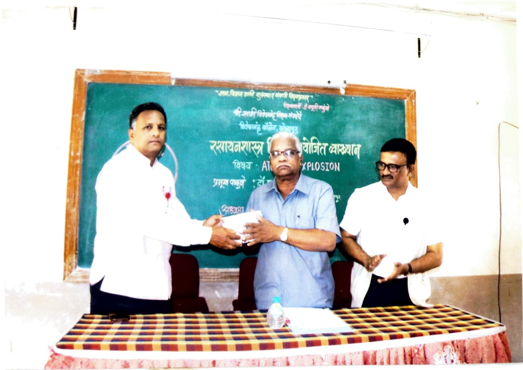
प्रमुख वक्त्यांची शुवागल करताना