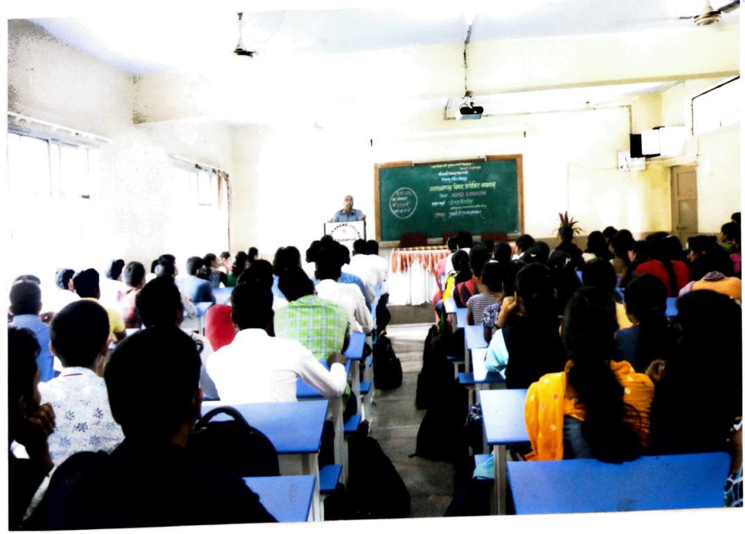
प्रमुख पाहणे विद्यार्थ्यांना मार्गदर्शन करताना