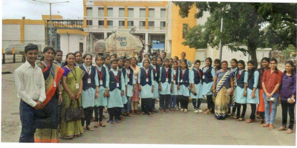
गोकुल दूध प्रक्रिया केंद्रास सहभागी प्राध्यापक, विद्यार्थिनी