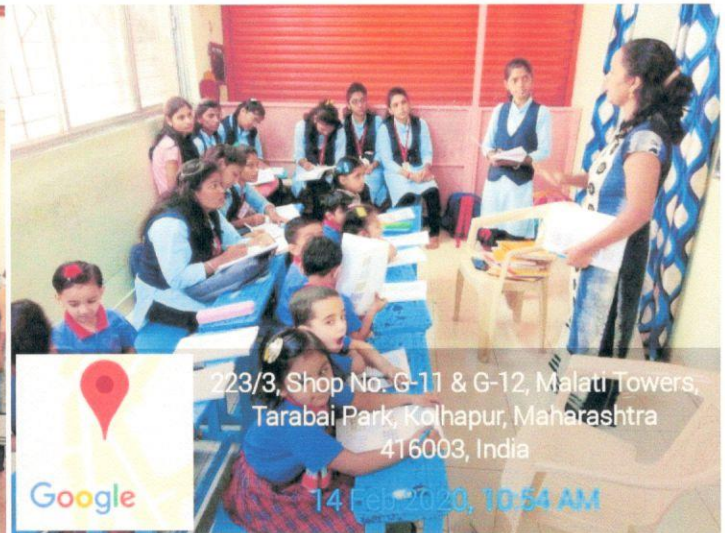
223/3, Shop No. G-11 & G-12, Malati Towers, Tarabai Park, Kolhapur, Maharashtra 416003, India