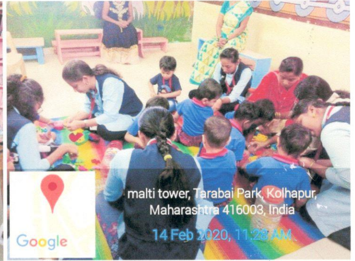
multi tower, Tarabai Park, Kolhapur, Maharashtra 416003, India