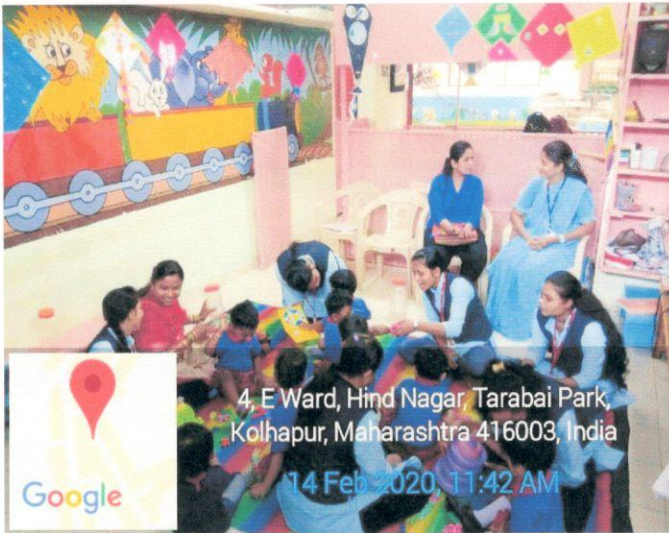
4, E Ward, Hind Nagar, Tarabai Park, Kolhapur, Maharashtra 416003, India