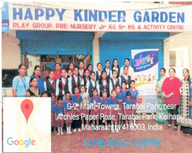
G-2, Malti-Towers, Tarabai Park, near Archies Paper Rose, Tarabai Park, Kolhapur, Maharashtra 416003, India