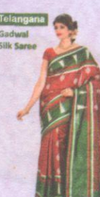
Telangana Gadwal Silk Saree

Rajasthan is famous for Bandhani or Bandhej, Leheriya - a special variety of tie and dye creating diagonal stripes in cotton, Silk, Crape, Chiffon and Kota doria fabrics.