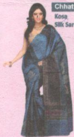
Chhattisgarh Kosa Silk Sarees

Jammu & Kashmir is popular for its printed pure silks, embroidered Crape, Chiffon Chirori sarees & Pashmina shawls with delicate hand embroidery