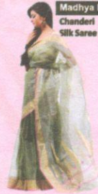
Madhya Pradesh Chanderi Silk Saree

Maharashtra is known for its rich and exquisite Paithani brocades & Vidarbha Karvati sarees and Kosa Silk.