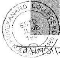
वलिवायव सपधरि कानुद कस्ताना कु. कु. सुप्रिया कुजावड, वी. ए. भाग-३

वलिवायव सपधरि कस्ताना कु. कु. सुप्रिया कानुद कुकुसुकुद, वी. ए. भाग-३.