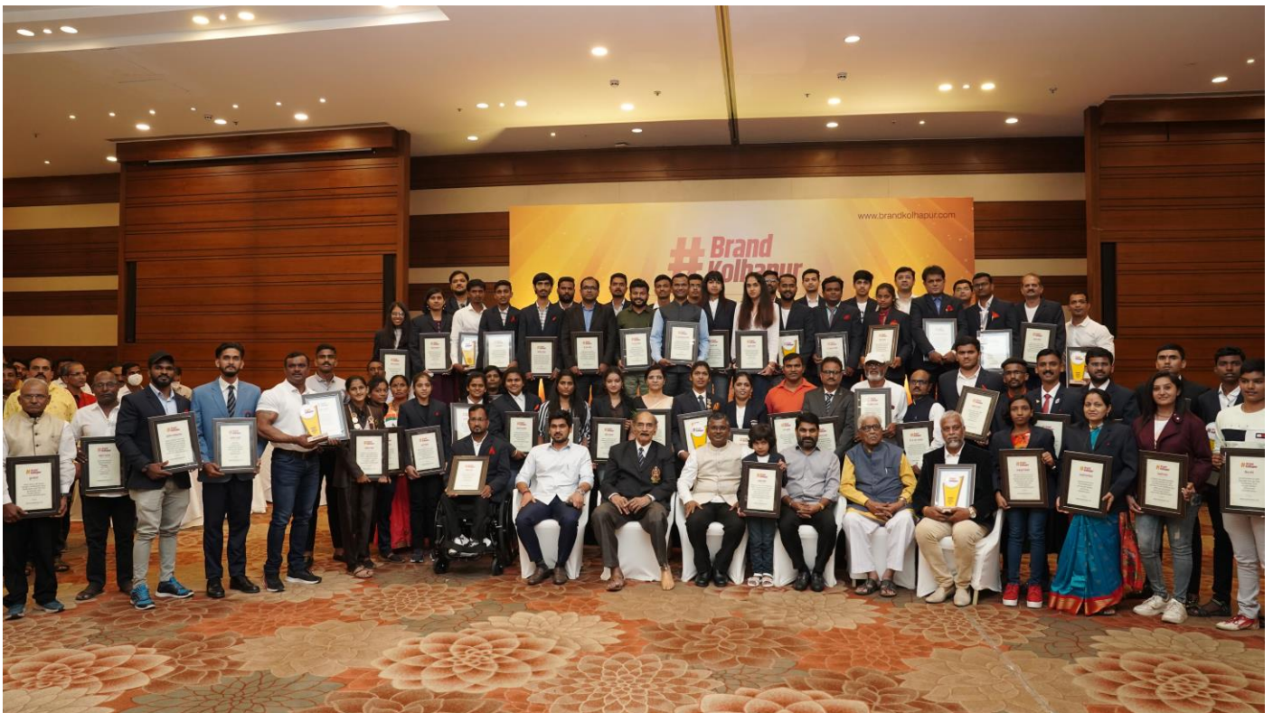
Group Photograph (07/11/2021)