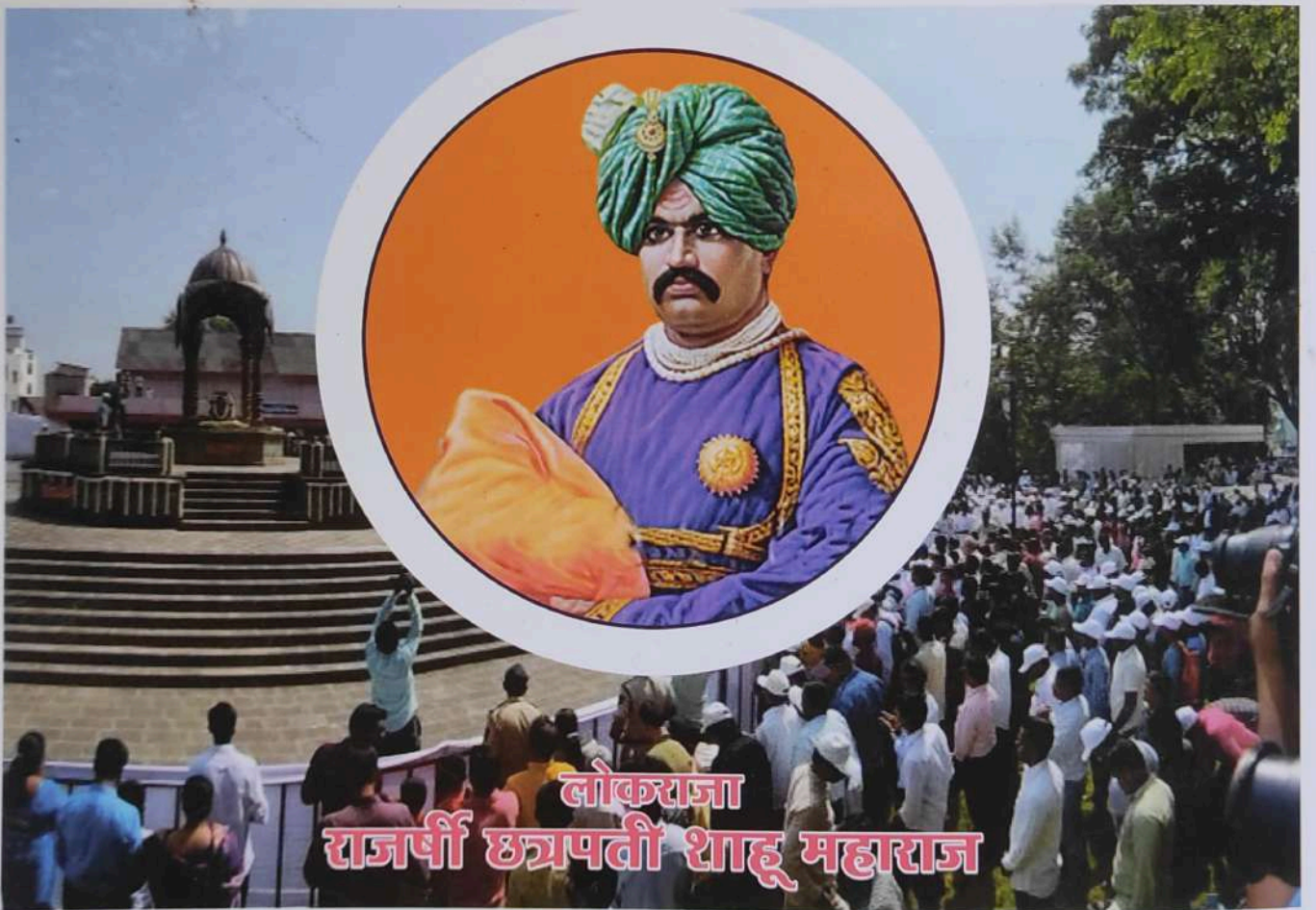
लोकराजा राजर्षि छत्रपती शाहू महाराज