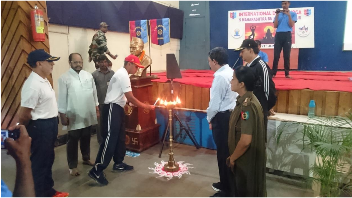
Dip-prajvalan for Yoda Day