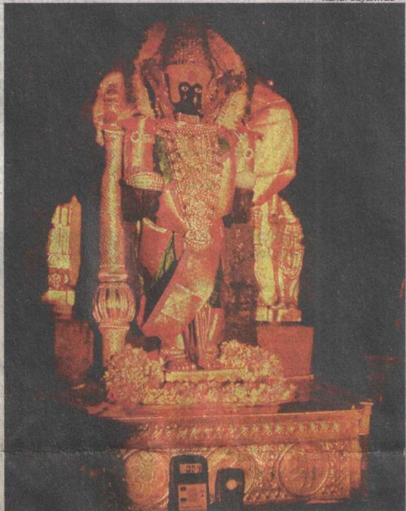
The festival witnesses sun rays falling directly on the deity's idol at the time of sunset

"There were no pollutants or cloud cover, which would obstruct the rays. Hence, the festival witnessed one of the most beautiful views on Friday. The illegal constructions and obstacles removed consistently by the Pashchim Maharashtra Devsthan Samiti (PMDS) and the Kolhapur Municipal Corporation (KMC) played an important