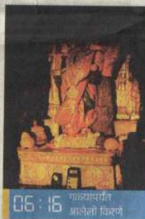
06:16 गळ्यापर्यंत आलेली किरणे