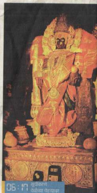
06:17 सूर्यकिरणो देवीच्या वेढ्यावर

श्री अंबाबाईच्या किरणोत्सवात गुरुवारी मावळीच्या सोनेरी किरणांनी देवीची मूर्ती उजळून निघाली. यावेळी महाद्वारातून आलेल्या सूर्यकिरणांनी देवीचा गाभारा उजळून निघाला होता. हा नवनम्य सोहळा पाहण्यासाठी भाविकांनीही मोठ्या संख्येने उपस्थिती लावली होती.