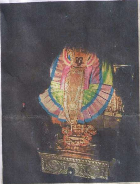
कोल्हापूर : श्री अंबाबाई मंदिरातील किरणोत्सवाच्या पार्श्वभूमीवर बुधवारी मावळतीच्या सूर्यकिरणांची पाहणी झाली. यावेळी ही सूर्यकिरणे देवीच्या मुखापर्यंत पोचली.