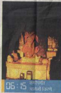
06:15 कनारेपर्यंत आलेली किरणे