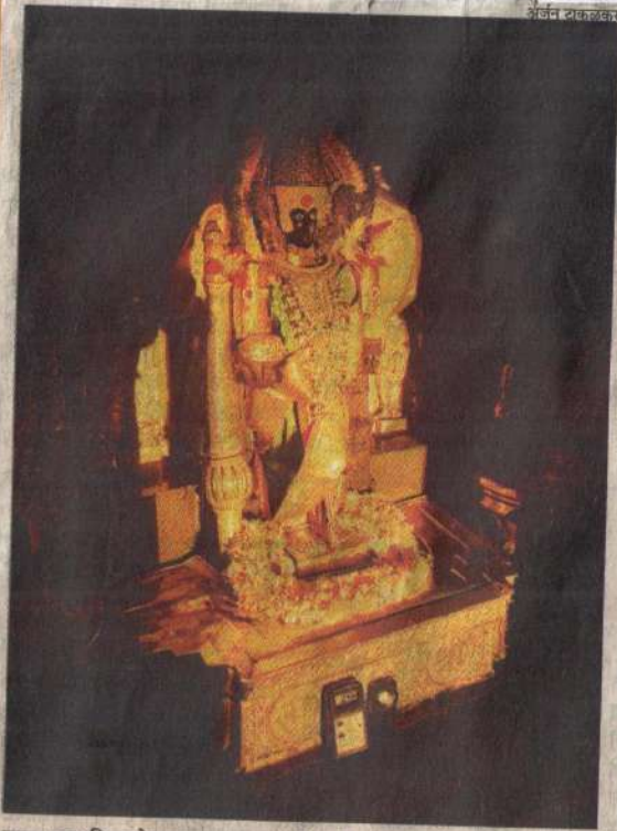
उत्तरायण किरणोत्सवाच्या दुसऱ्या दिवशी शुक्रवारी मावळतीची किरणे देवीच्या कमरेला स्पर्श करत मुखापर्यंत पोहोचली.