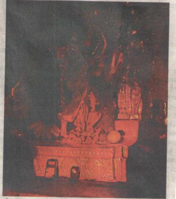
कोल्हापूर : अंबाबाई मंदिरातील किरणोत्सव सोहळ्याच्या चौथ्या दिवशी रविवारी मूर्तीच्या गुडघ्यापर्यंत मावळतीची सूर्यकिरणे पोचली.

अंबाबाई मंदिर परिसरातील सर्व विद्युत जोडण्या आता अंडरग्राऊंड केल्या जाणार असून भाविकांच्या सुरक्षिततेसाठीची उपाययोजना म्हणून लवकरच त्याची कार्यवाही केली जाणार आहे. दरम्यान, अंबाबाई आणि जोतिबा मंदिरांचे पहिल्यांदाच स्ट्रक्चरल ऑडिटची प्रक्रियाही अंतिम टप्प्यात आली असून लवकरच ऑडिटला प्रारंभ होणार आहे. मंदिराच्या शिखरांपासून ते मंदिर परिसरातील सर्व मूर्ती आणि छोट्या मंदिरांचेही ऑडिट केले जाणार आहे.