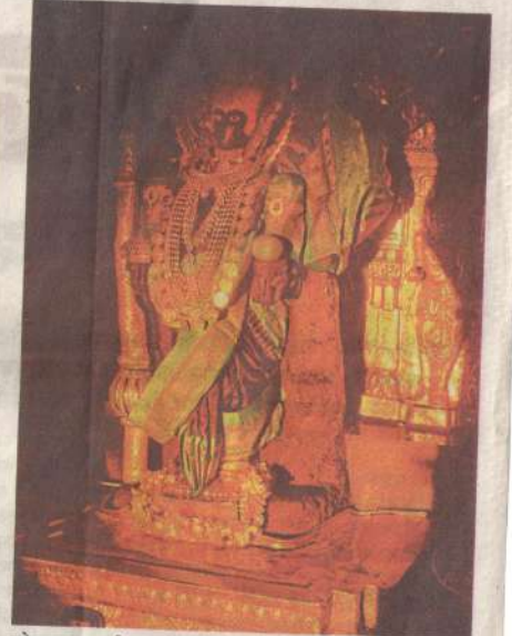
कोल्हापूर : श्री करवीर निवासिनी अंबाबाई देवीपर्यंतचा प्रवास सूर्यकिरणांनी पूर्ण केला.

गरूड मंडपातून पुढे जाऊ लागली तसे अनेकांनी मोबाईल कॅमेरा 'ऑन' केले. काहींनी तर हे क्षण मित्र-मैत्रिणी, नातेवाईक, सहधर्मीना पाठविले. उद्याही (ता. २) किरणोत्सव सोहळा होईल.