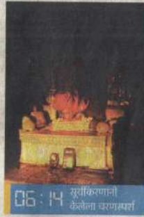
06:14 सूर्यकिरणानी केलेला चरणास्पर्श

चाचणीदरम्यान पूर्ण क्षमतेने किरणोत्सव झाला. त्यामुळे गुरुवारीही असाच सोहळा 'याची देही, याची डोळा' पाहायला मिळणार याची खात्री असल्याने किरणोत्सवाच्या (पान ४ वर)