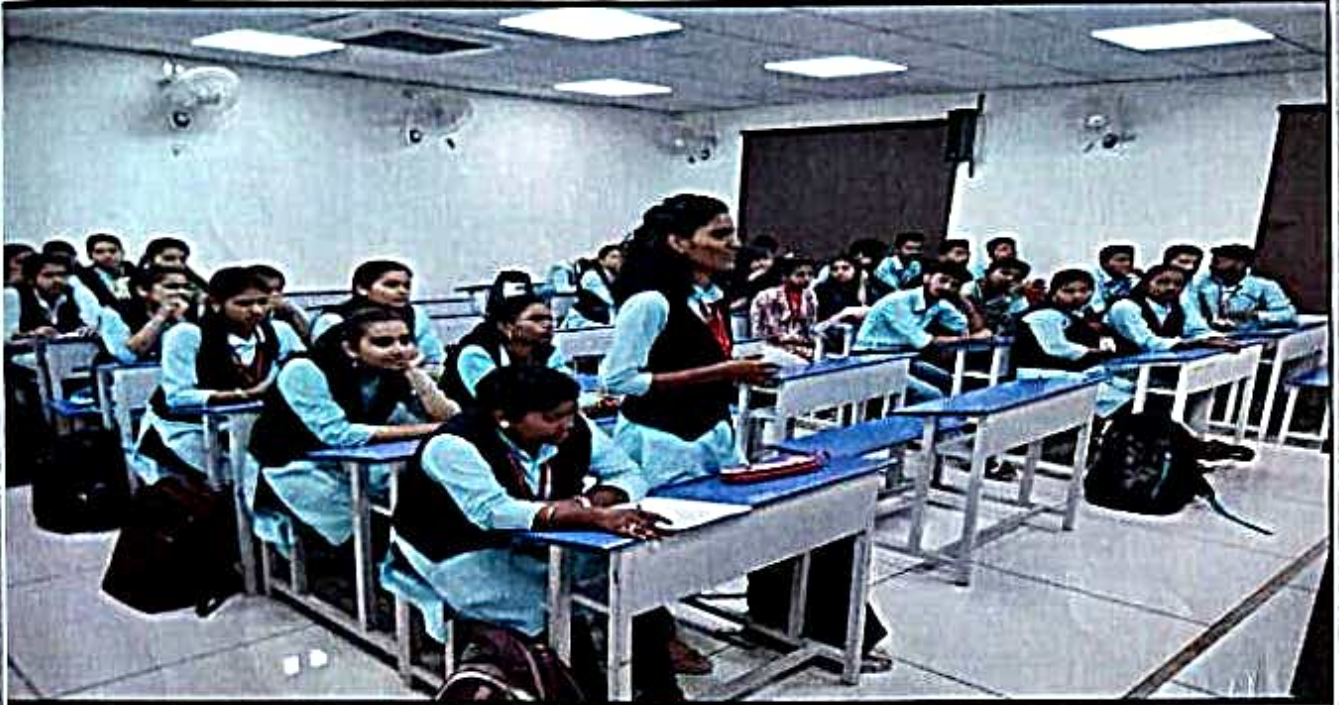
गट चर्चेत सहभागी विद्यार्थी