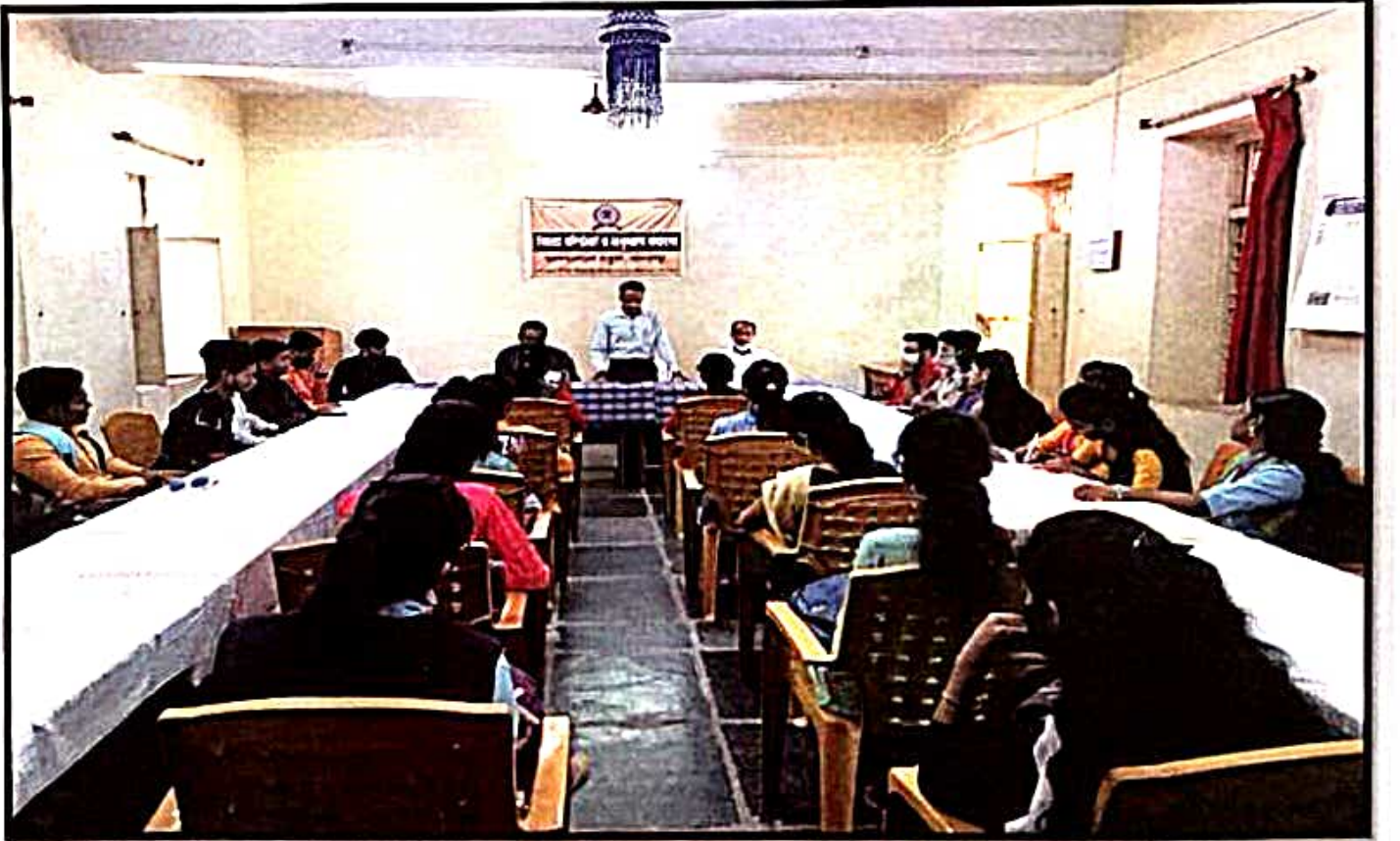
बालकल्याण संकुल येथील मा कदम सर यांनी विद्यार्थ्यांना मार्गदर्शन. माहिती दिली .