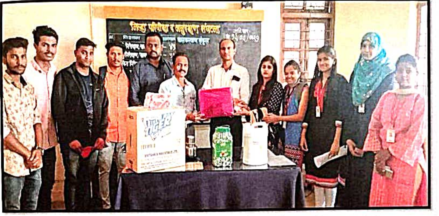
समाजशास्त्र विभागाच्या वतीने कोल्हापूर येथील बालकल्याण संकुल येथे मास्क, सॅनिटायझर, तसेच मुलांना खाऊ म्हणून बिस्कीट चा बॉक्स व चॉकलेट इ. साहित्याचे वाटप करण्यात आले..