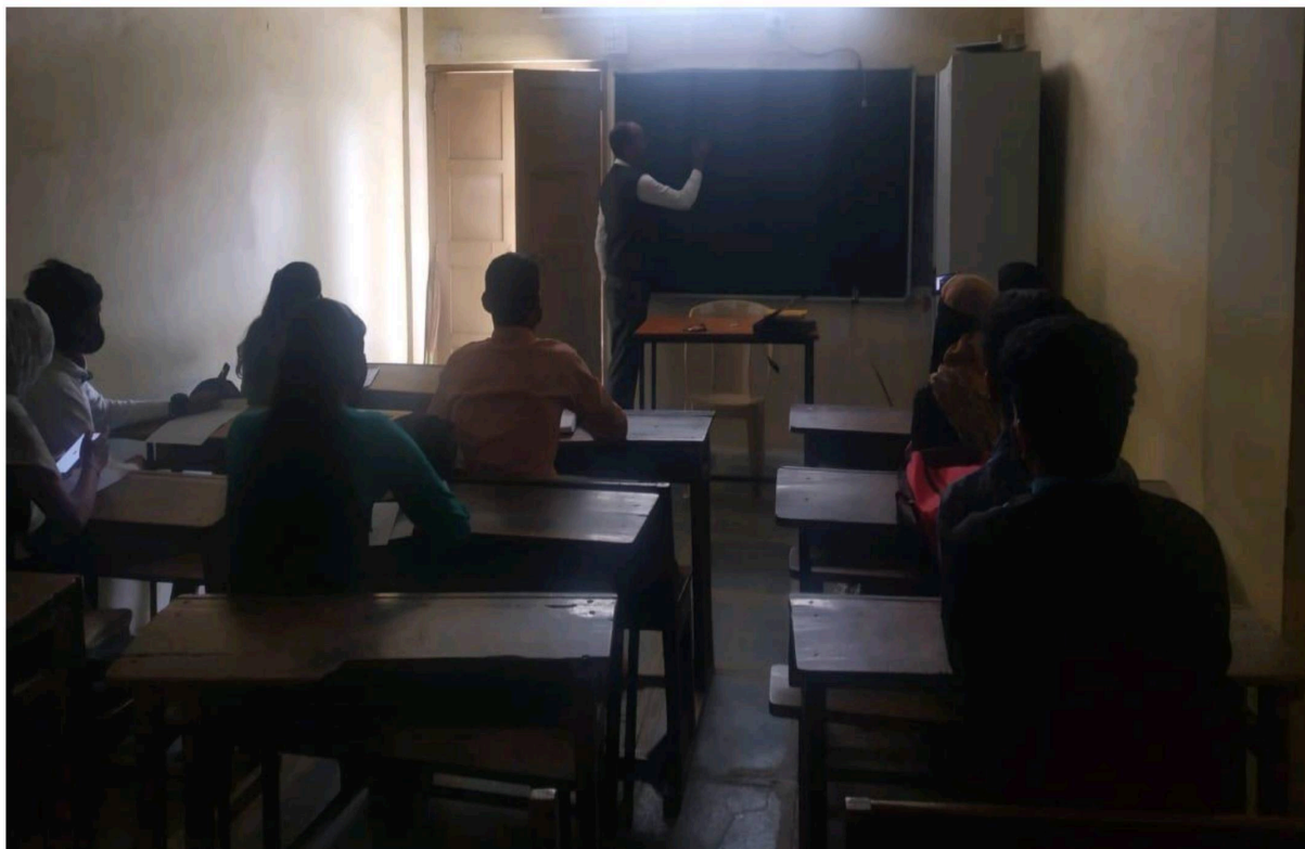
VALUE ADDED COURSE OF AGRICULTURE ENTREPRENEURSHIP