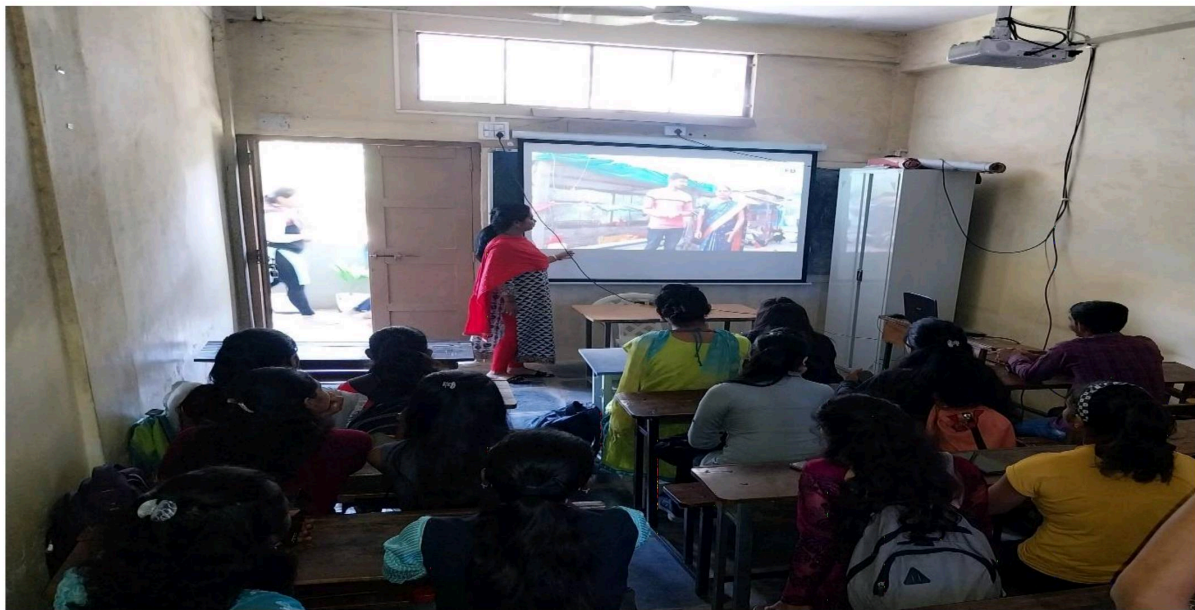
VALUE ADDED COURSE OF AGRICULTURE ENTREPRENEURSHIP