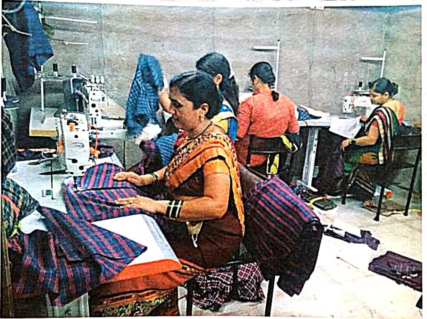
काम करताना महिला.