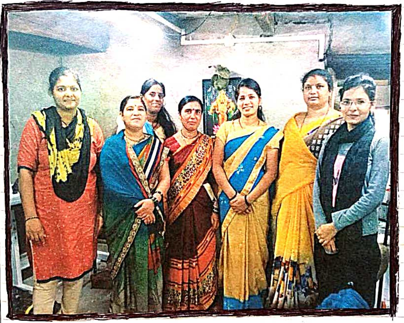
तेथील महिला कामगारसोबत छायाचित्र.

तेथे घेत दिल्यानंतर काढलेली अशी छायाचित्रे-