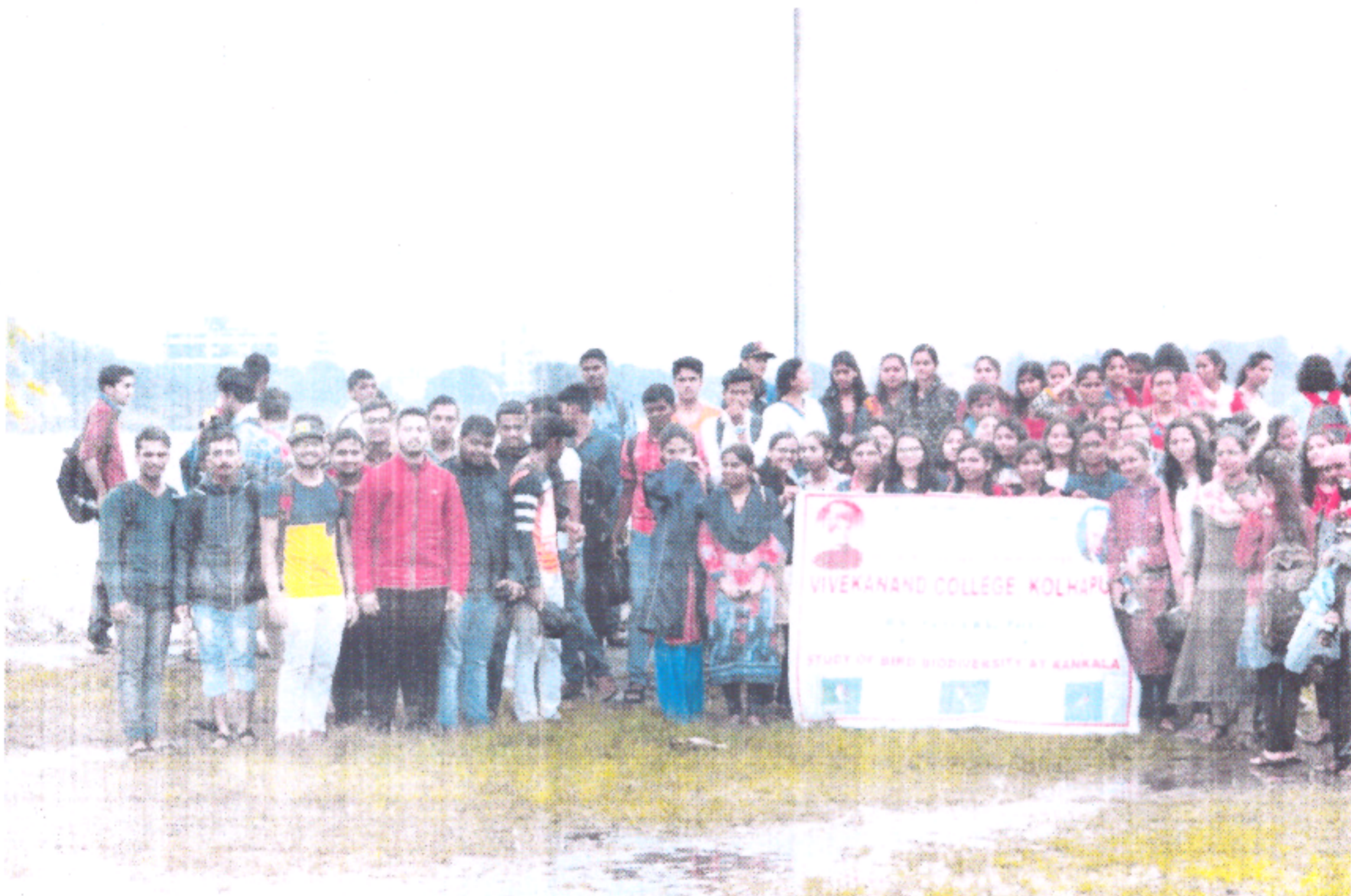
Group Photo B.Sc. part II and B.Sc. Part III