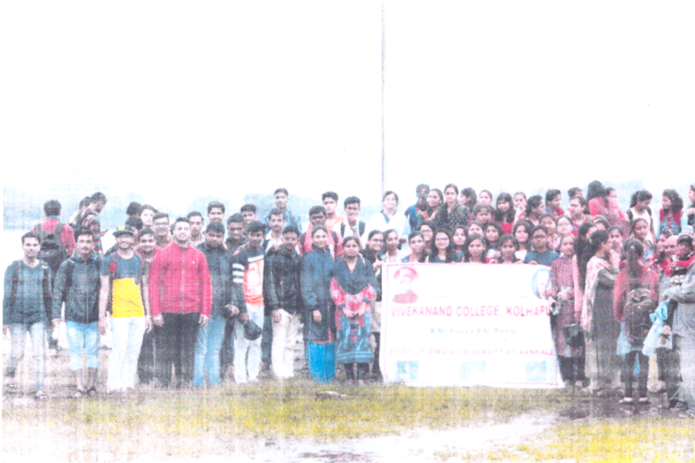
Group Photo B.Sc. part II and B.Sc. Part III