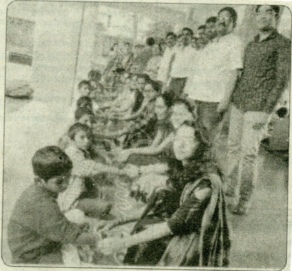
बालसंकुल येथे रक्षाबंधन सोहळ्यानिमित्त उपस्थित विवेकानंद कॉलेज, एन.एस.एस. चे स्वयंसेवक. ५