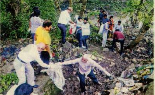
कोल्हापूर महापालिकेच्या वतीने लोकसहभागानून सुरु असलेल्या स्वच्छता मोहिमेत रविवारी जयंती नाला परिसरात स्वच्छता करण्यात आली. दुसऱ्या छायाचित्रात या मोहिमेत विद्यार्थ्यांनी हिरिरीने सहभाग नोंदविला.

डॉ. डी. वाय. पाटील कॉलेजच्या वतीने पचाराने गार्डन येथे व यशवंतराव चव्हाण (के.एम.सी.) कॉलेजच्या विद्यार्थी-विद्यार्थिनींनी राजमाता जिजाबाई गर्ल्स हायस्कूल येथे स्वच्छता मोहीम राबविली. स्वरा फौंडेशनच्या वतीने रिलायन्स मॉलमार्गील परिसराची स्वच्छता करून वृक्षारोपण करण्यात आले. तसेच