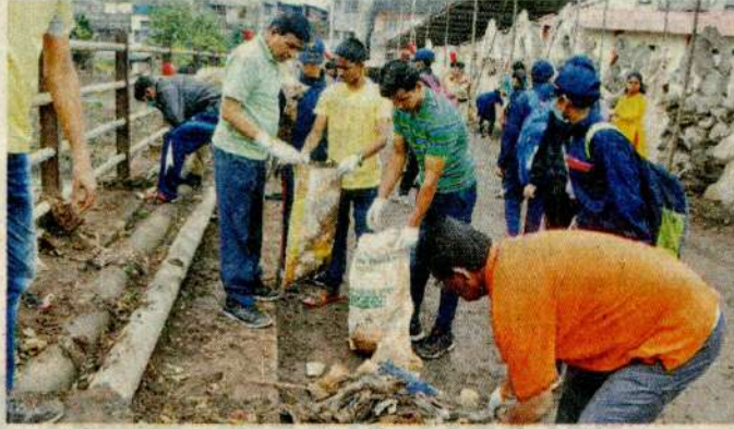
शाहूपुरी कुंभार गल्ली परिसरात रविवारी स्वच्छता मोहीम राबविली.

महापालिका प्रशासनाच्या वतीने दर रविवारी स्वच्छता मोहीम घेतली जाते. सलग एकोणिसाव्या रविवारी गणरायाच्या आगमनानिमित्त शाहूपुरी कुंभार गल्लीमध्ये स्वच्छता घेण्यात आली. मोहिमेला विद्यार्थ्यांनी उत्स्फूर्त प्रतिसाद दिला. विवेकानंद , कॉमर्स व राजर्षी शाहू कालेजच्या एनसीसी