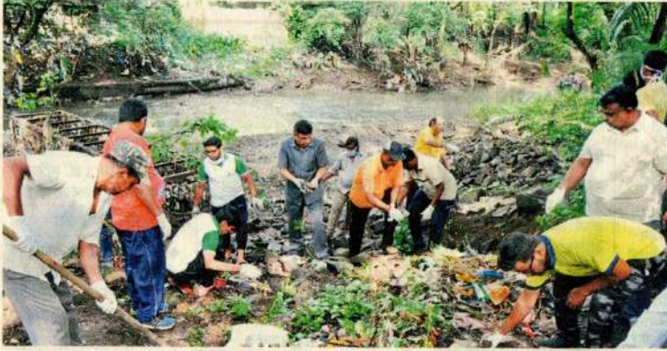
कोल्हापूर महापालिकेच्यावतीने लोकसहभागानून सलग २४ व्या रविवारी महास्वच्छता अभियान राबविण्यात आले. यावेळी जयंती नाल्याच्या काठावर स्वच्छता करण्यात आली.