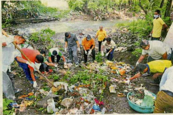
कोल्हापूर : शहरात आज सलग चोविसाव्या रविवारी महास्वच्छता अभियान राबविण्यात आले.

ही मोहीम पंचगंगा नदीघाट परिसर, दसरा चौक, सर्व मुख्य