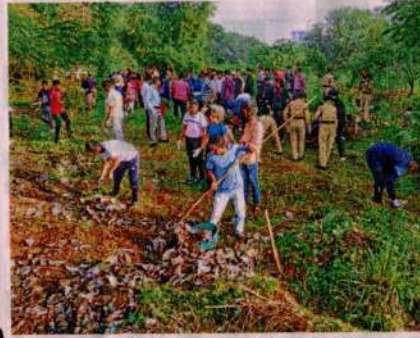
कोल्हापूर : महापालिकेतर्फे शहरात सलग तेराव्या रविवारी महास्वच्छता अभियान राबविण्यात आले. यात सहभागी नागरिक, विद्यार्थी.

या मोहिमेअंतर्गत रंकाळा परिसराचीही स्वच्छता केली. यात न्यू कॉलेजच्या ४० विद्यार्थिनींनी रंकाळा परिसरातील उद्यानाची