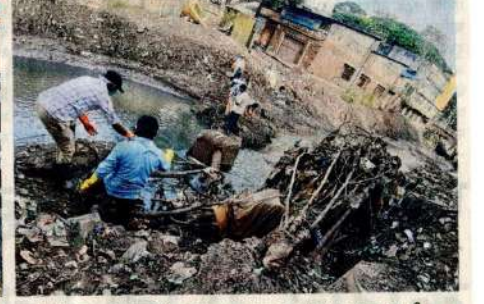
कोल्हापूर शहरातील महापूर ओसरल्यानंतर महापालिकेने लोकसहभागातून अचलबिलेल्या महास्वच्छता मोहिमेत रविवारी शाहूपुरी कुंभार गल्लीत जयंती नाल्याच्या काठावर स्वच्छता करण्यात आली. दुसऱ्या छान्याचित्रात लक्ष्मीपुरीत विल्सन पूल, संभाजी पूलनजीक नाल्यात अडकलेला कचरा काढण्यात आला.