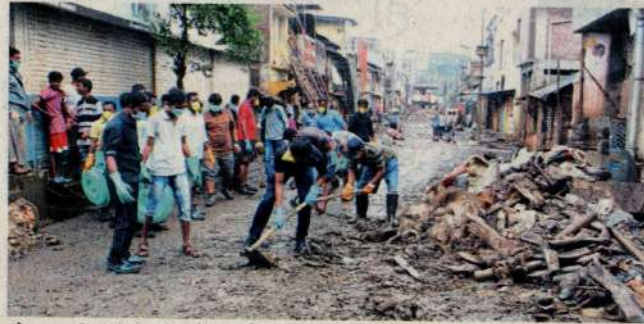
कोल्हापूर : शिवाजी विद्यापीठातर्फे शहर परिसरात स्वच्छता कारताना एनएसएसचे स्वयंसेवक.

लक्ष्मीपुरी येथे रिलायन्स मॉलच्या परिसरातील विविध गल्ल्यांमध्ये पुराच्या पाण्यामुळे प्रचंड नुकसान झाले आहे. घरे, दुकानांसह रस्त्यांवर मोठ्या प्रमाणात चिखलाचे थर साचले आहेत. राष्ट्रीय सेवा योजना तसेच