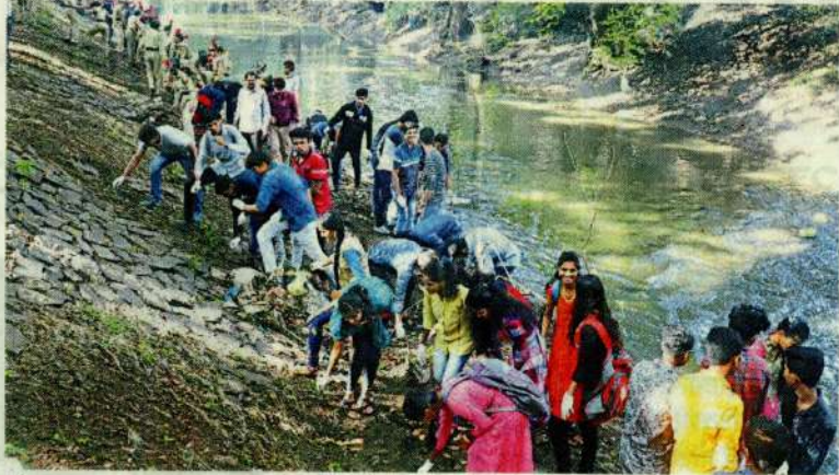
कोल्हापूर : शहरात सलग २३व्या रविवारी महास्वच्छता अभियान राबविण्यात आले. या मोहिमेत सहभागी नागरिक, विद्यार्थी आदी.

स्वरा फाऊंडेशनतर्फे रिलायन्स मॉलमागील परिसराची स्वच्छता करून वृक्षारोपण केले. तसेच उद्यान, पवडी, आरोग्य विभाग व गडकोट किल्ला संवर्धन समितीतर्फे बिंदू चौक येथील तटबंदीवरील झाडेझुडपे काढून