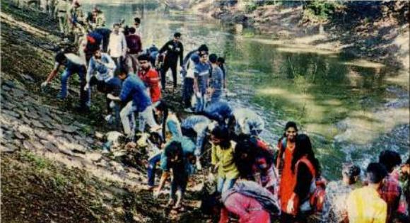
कोल्हापूर महापालिकेच्या वतीने लोकसहभागानून सुरु असलेल्या स्वच्छता मोहिमेत रविवारी जयंती नाला परिसरात स्वच्छता करण्यात आली. दुसऱ्या छायाचित्रात या मोहिमेत विद्यार्थ्यांनी हिरिरीने सहभाग नोंदविला.

उद्यान, पवडी, आरोग्य विभाग व गडकोट किल्ला संवर्धन समितीच्या वतीने बिंदू चौक येथील तटबंदीवरील झाडेझुडपे काढून तटबंदीची स्वच्छता करण्यात आली. स्वच्छता केल्यातंतर रोगराई पसरू नये यासाठी या परिसरात धूर व औषध फवारणी करून क्लीनिंग पावडर टाकण्यात आली.