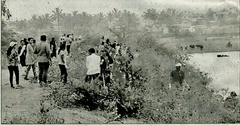
कणेरीवाडी : पाझर तलावाच्या बंधाऱ्याची स्वच्छता करताना ग्रामस्थ आणि विवेकानंदचे विद्यार्थी.