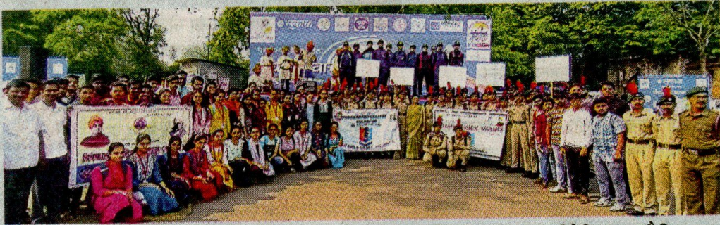
पंचगंगा वाचव्या मोहिमेत सहभागी झालेले विवेकानंद कॉलेजचे विद्यार्थी, विद्यार्थिनी व छात्रसैनिक.

कार्यक्रमांत सहभागी होण्याची ग्वाही यानिमित्ताने त्यांनी दिली.