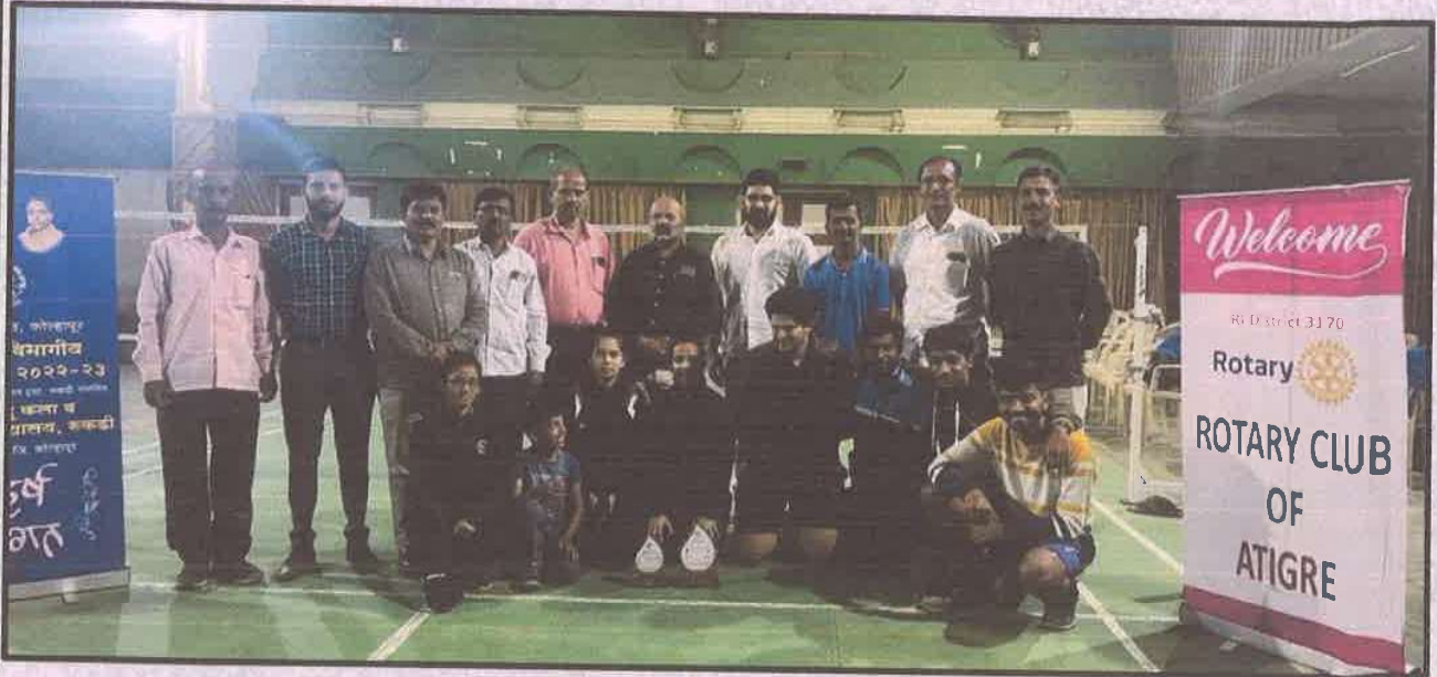
Organized Kolhapur Zonal Badminton Tournament by Vivekanand College, Kolhapur