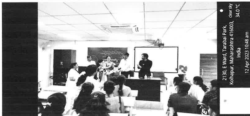
Felicitation of resource person of a one day workshop by IQAC Coordinator